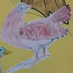
ПЕРАД су оне домаће животиње које су покривене перјем. У онема најчешће су: квокачи, ћурке, гуске и патке. Живе у стајалишту и исхрана се различита.