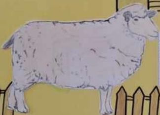
ОВЦА је мекка и плаћкава животиња. Трети део је прекривен косом која се брзо мења. Месо од ове животиње је једно од најбољих. Младунци од ове животиње су јагњаци. Живе у шталу или тогу, а исхране се травом.