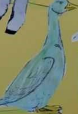
ПЕРАД су оне домаће животиње које су прекривене перјем. У онема највећим перјемима имају: квокале, ћуре, гуске и патке. Месо у онема највећим перјемима је најбоље. Младунци од ове животиње су пилићи, квокади, ћурци и патке. Оплођава се паровима.