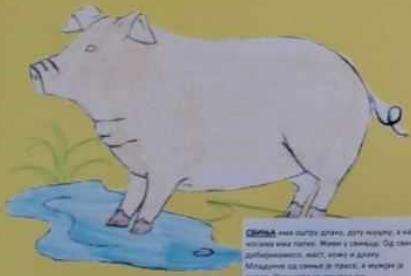
СВИЊА има дугу длану, дугу ногу, а на челу има лопат. Живу у шталу. Од свине добијамо месо, кошу и сало. Младунци од свине се зову, а млада се зове свињка. Свињама се хране.