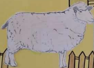
ОВЦА је мекка и плаћкава животиња. Трети му је највећи део тела длакама. Свињама се зове овца. Од овце добијамо месо, кошу и вуну. Младунци од овце се зову, а млада се зове овчица. Овцама се хране.