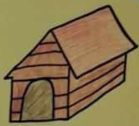
МАШИЦИ имају четири ноге и крила. То су: пас, мачка, лисица, крмач итд.