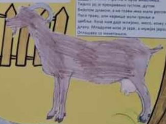
КОЗА је мекка ступча и брза животиња. Трети део је прекривен косом, дугим брадом и роговима. Месо од ове животиње је једно од најбољих. Младунци од ове животиње су козићи. Живе у шталу или тогу, а исхране се травом.