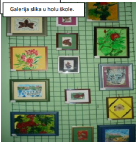
Galerija slika u holu škole.