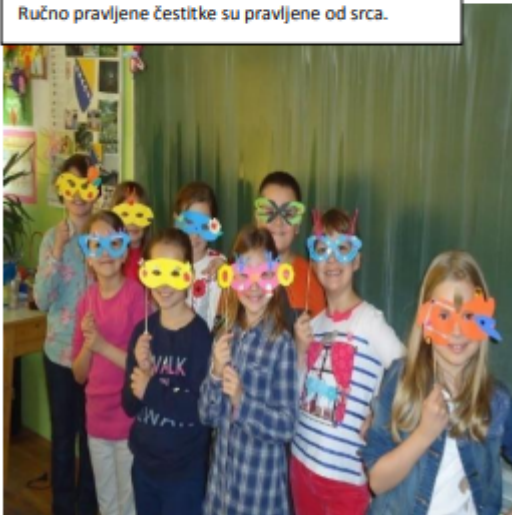
Maske pravljeni od različitih vrsta starog papira.