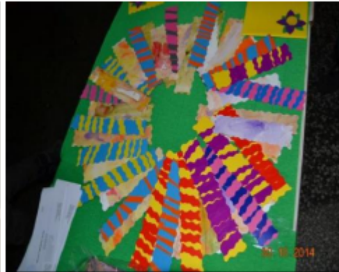
Pokazivači za čitanje od hamer papira/kolaž-papira.