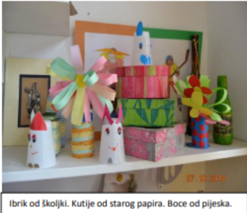
Ibrik od školjki. Kutije od starog papira. Boce od pijeska.

Sekcija Mali modelari nudi raznovrstan i kvalitetan program koji se mijenja svake školske godine, omogućava kreativno izražavanje, učenje kroz saradnju i izradu unikatnih radova.