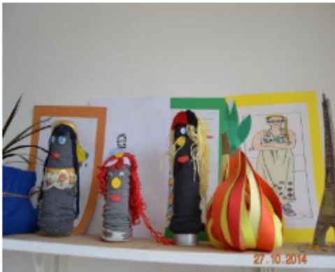
Lutke od starih boca i čarapa.