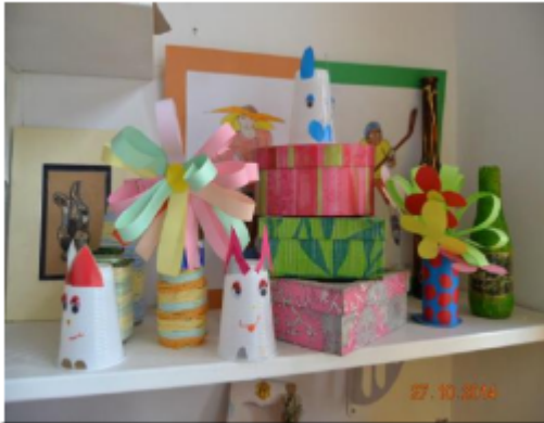
Ibrik od školjki. Kutije od starog papira. Boce od pijeska.

Sekcija Mali modelari nudi raznovrstan i kvalitetan program koji se mijenja svake školske godine, omogućava kreativno izražavanje, učenje kroz saradnju i izradu unikatnih radova.