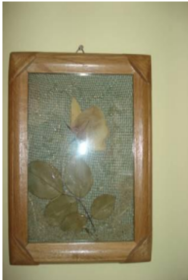
Ruže su simbol ljubavi. Od osušene ruže u pijesku, možemo napraviti sliku i ukrasiti