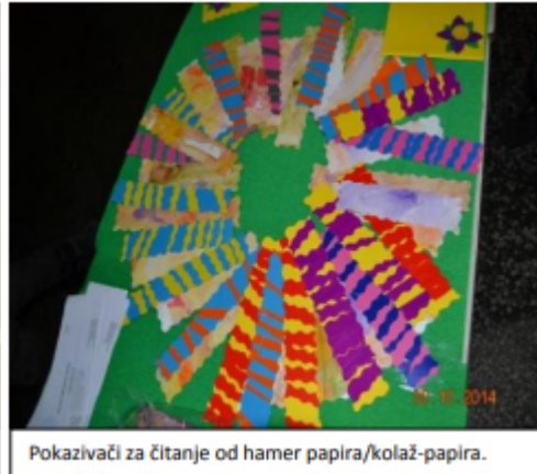
Pokazivači za čitanje od hamer papira/kolaž-papira.