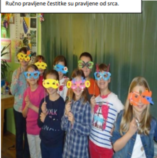
Maske pravljeni od različitih vrsta starog papira.