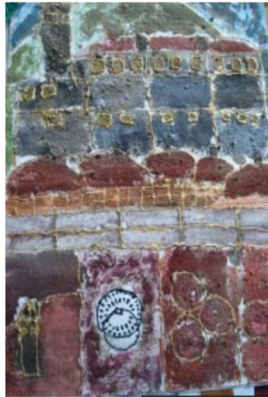
Pijesak je dio prirode. Možemo ga bojiti i s njim kreirati sliku. Mogućnosti su velike.