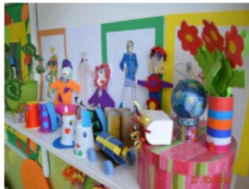
Lutke od plastičnih čaša i flica. Kutije od starog papira.