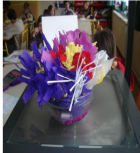
Kreacije od krep papira (cvijeće).