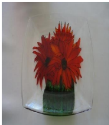
Želite pokloniti unikatan poklon? Budite originalni i ukrasite flašu ili zdjelu bojama za staklo i konturnim bojama.