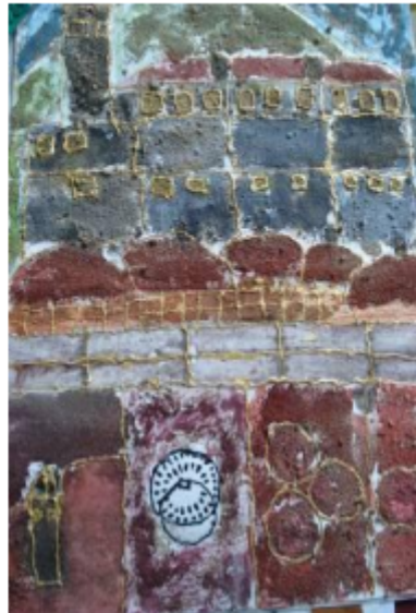
Pijesak je dio prirode. Možemo ga bojiti i s njim kreirati sliku. Mogućnosti su velike.