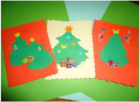
Ručno pravljeni čestitke su pravljeni od srca.