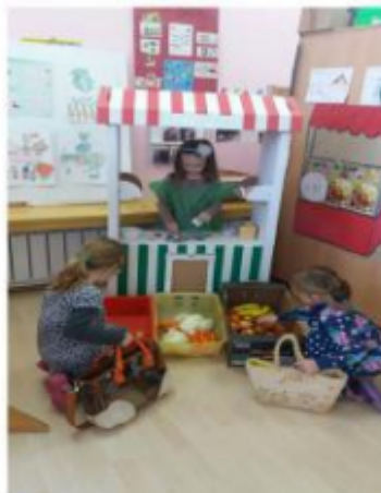
Инпровизована тезга Спонтана дечија игра- игре улога