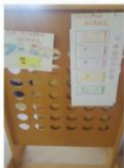
Дечија игра са електронским и Папирним новцем